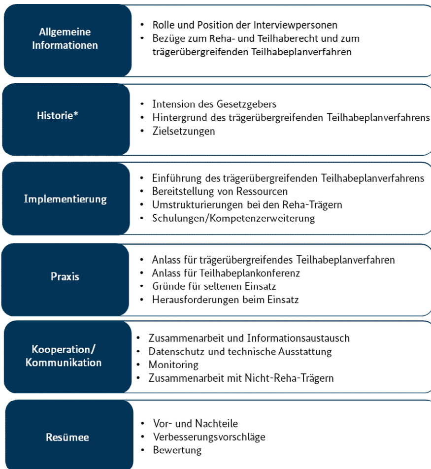
Abbildung 2.1 Themenliste des Interviewleitfadens für die Expertengespräche und Fokusgruppen

Sowohl bei den Experteninterviews als auch bei den Fokusgruppen diente ein Leitfaden als strukturierendes Element für die Gesprächsführung, wodurch sichergestellt werden konnte, dass alle relevanten Themen angesprochen wurden. Abbildung 2.1 gibt einen Überblick über die Themenliste des Interviewleitfadens.